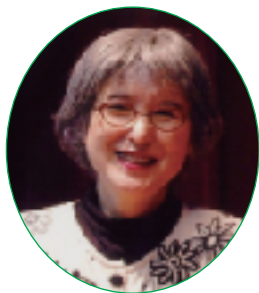
角野栄子 ◎ かどの えいこ

東京生まれ。ブラジルに2年間滞在した体験をもとに『ルイジニョ少年ブラジ ルをたずねて』（ポプラ社）を書き、作家としてデビュー。代表作『魔女の宅急便』 （福音館書店）をはじめ『ズボン船長さんの話』（福音館書店）、「アッチコッチソツ チのちいさなおばけ」シリーズ（ポプラ社）など作品多数。