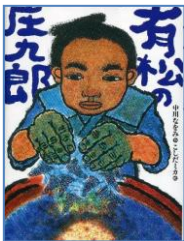
『有松の庄九郎』 中川なをみ作 こしだミカ絵 新日本出版社 (2012)

有松絞りのことは、みなさんよくご存知のことと思いますが、この本は、有松絞りの誕生を描いたおはなしです。