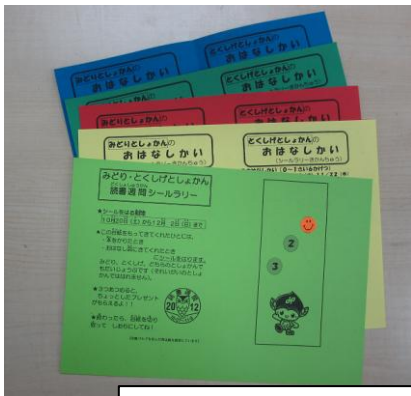
シールラリーの台紙