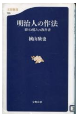
『明治人の作法』 横山 謙也 著 文藝春秋(2009)

「いただきます」と皆で唱和して一斉に食べる食事の作法や普段、何気なくやっているお辞儀の角度が形作られたのは、何と明治時代!日本が西洋と出会った中で生み出されたり、明治政府が推し進めたものでした。江戸時代から昭和初期までの日本人の作法の来歴をつづったこの本から、作法は時代と共に変化しますが、相手を敬い、気遣う心の大切さは変わってはいけなさと実感できます。現在のマナーを考える上でも、その成り立ちや考え方を振り返ってみませんか。