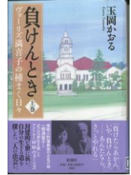
『負けんとき ヴォーリズ満喜子の種まく日々』 上・下 玉岡かおる著 新潮社(2011)

さて、最近知ったのですが、大正から昭和初期に活躍した建築家、ウィリアム・メレル・ヴォーリズの事務所が設計した教会がひっそりと名古屋市内にあります。 徳川園にほど近い住宅地にあり、今年、国の登録有形文化財としてニュースにもなったので、ご存知の方もいらっしゃるかもしれません。 あざやかな赤い屋根の建物に一步中に入ると、使い込まれた木の床や柱と、白い壁のコントラストがうつくしい。シンプルな中にあたたかみがあり、自然光を取り入れた十字の窓は、信者でなくても敬虔な気持ちを引き起こします。 ヴォーリズといえば、近江八幡や神戸女学院を思い浮かべがちですが、名古屋にもこんな素敵な建物があったのかとあらためて思いました。 この小説は、ヴォーリズの妻、一柳満喜子の生涯を書いたものですが、彼の日本での仕事ぶりや人柄がしのばれる作品です(上下巻)。 今は予約も落ち着いているので、比較的早く手に入りますよ。