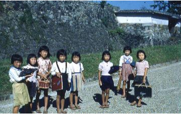
(上)市役所と県庁 (下)名古屋城内の女の子たち

こんにちは、徳重図書館です。 図書館前の地区会館ギャラリーにて、『ウィリアム・S・ペリー氏がカラーで撮った戦後の名古屋<1949~1950>展』が開催中です。 (10月31日まで) 昭和24年の日本では珍しいカラー写真で当時の名古屋を振り返ります。 図書館内でも名古屋の写真集や昭和の世相に関する本を展示・貸出しています。また、写真展にちなんで講演会もご紹介します。29日(土) 14時~15時。[14日(金)より受付 定員30人] どうぞご参加ください。