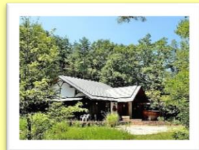
藪内正幸美術館(山梨県)