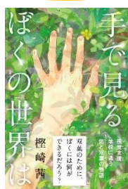
『手で見るぼくの世界は』 榎崎茜/作 くもん出版