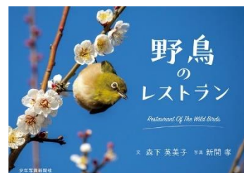
『野鳥のレストラン』 森下英美子/文 少年写真新聞社