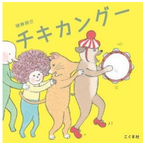
『チキカンゲー』 樋勝朋巳／作 こぐま社