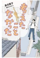
『考えたことなかった』 魚住直子／著 偕成社