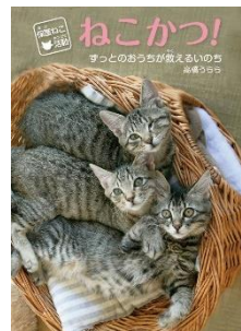
『保護ねこ活動ねこかつ!』 高橋うらら／著 岩崎書店