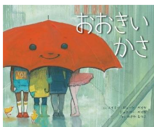
『おおいいかさ』 エイミー・ジューン・ベイツ／さく 化学同人