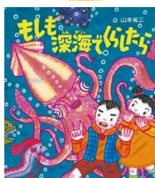
『もしも深海でくらしたら』 山本省三／作 WAVE出版