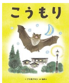
『 こうもり 』 アヤ井アキコ / 作 偕成社