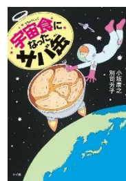
『 宇宙食になったサバ缶 』 小坂康之 / 著 小学館