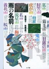
『雨の名前』 高橋順子/文 佐藤秀明/写真 (小学館) [451]