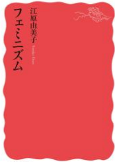
『フェミニズム (岩波新書 新赤版)』 江原由美子/著 (岩波書店) [3671]