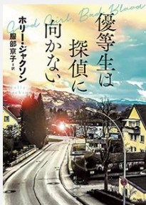
『優等生は探偵に向かない』 (創元推理文庫) ホリー・ジャクソン/著 服部京子/訳 (東京創元社) [933(英米文学)]

「こんなことに首をつっこんではいけない」頭ではわかっているけれど、動かすにはられない女子高校生ピップ。友人の兄の失踪事件を調査し、真相を暴きます。SNSを駆使して行動する様は、まさに現代の女子高生。