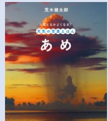
『あめ (空となかよくなる 天気の写真えほん)』 荒木健太郎/文・写真・絵(金の星社) [ちしきえほん(じどう図書)]