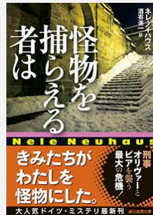
『怪物を捕らえる者は (創元推理文庫)』 ネレ・ノイハウス/著 酒寄進一/訳 (東京創元社) [943]