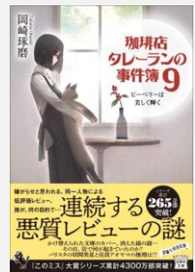
『珈琲店タレーランの事件簿 9 (宝島社文庫)』ピーベリーは美しく輝く』 岡崎琢磨/著 (宝島社) [F(小説)]