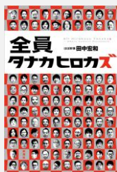
『全員タナカヒロカズ』 田中宏和／著(新潮社)【288】