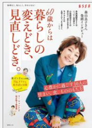
『60歳からは暮らしの变えどき、见直しどき。』 (扶桑社)【590】