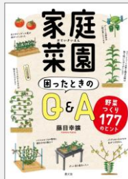
『家庭菜園困ったときのQ&A 野菜づくり177のヒント』 藤目幸廣／著(農山漁村文化協会)【6269】