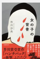
『女の子の背骨』 市川沙央／著(文藝春秋)【F(小説)】