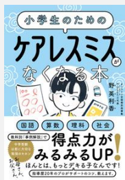
『小学生のためのケアレミスがなくなる本』 野英利香／著(すばる舎)【3799】