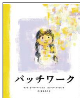
『パッチワーク』 マット・デ・ラ・ペーニャ 文 岩波書店