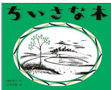
『ちいさな木』 かどのまいこ 作 偕成社