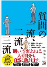
『質問の一流、二流、三流』桐生稔/著(明日香出版社)