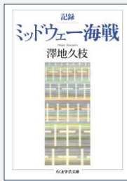
『記録ミッドウェー海戦』 澤地久枝/著(筑摩書房)