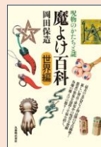
『魔よけ百科 世界編』 岡田保造/著 丸善