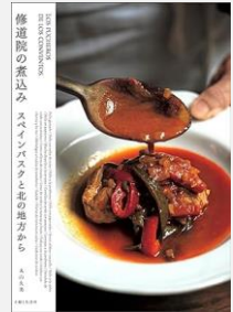
『修道院の煮込み スペインバスクと北の地方から』丸山久美/著(主婦と生活社)