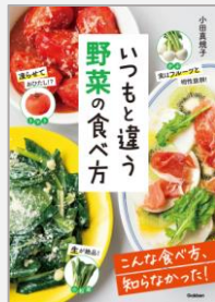
『いつもと違う野菜の食べ方』 小田真規子/著(Gakken)