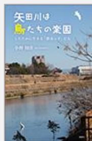
『矢田川は鳥たちの楽園』 小野知洋/著(風媒社)