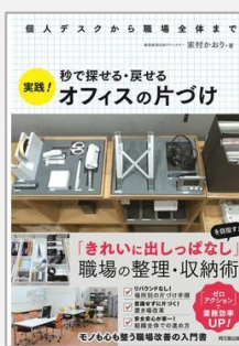
『秒で探せる・戻せる 実践! オフィスの片づけ』 家村かおり/著(同文館出版)