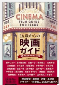
『14歳からの映画ガイド』 河出書房新社/編(河出書房新社)