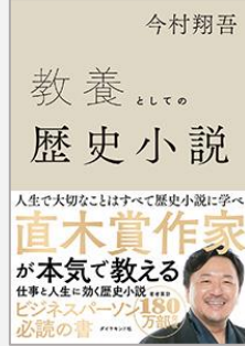
『教養としての歴史小説』 今村翔吾/著(ダイヤモンド社)