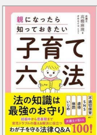
『子育て六法 親になったら知っておきたい』 高橋麻理/著(日東書院本社)