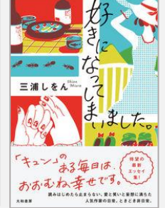
『好きになっちゃいました。』 三浦しをん/著(大和書房)