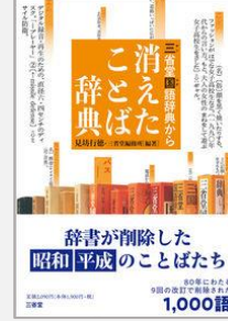
『三省堂国語辞典から消えたことば辞典』 小野寺史宜/著(柏書房)