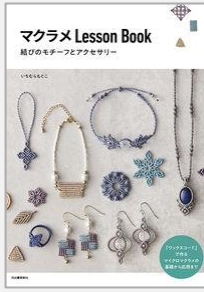
『マクラメLessonBook 結びのモチーフとアクセサリー』 大塚隆史 堀田孝之/著(飛鳥新社)