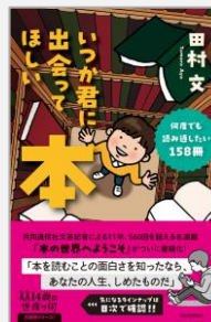
『いつか君に会ってほしい本』 田村文/著(河出書房新社)