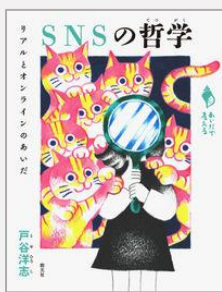
『SNSの哲学 リアルとオンラインのあいだ』 戸谷洋志/著(創元社)