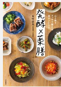
『発酵×薬膳 心と体をスッキリ整える楽チンレシピ』 大竹宗久/著(三笠書房)