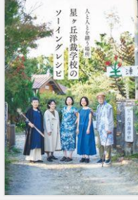
『星ヶ丘洋裁学校のソーイングレシビ人と人との繕う場所』 星ヶ丘洋裁学校／著 (主婦と生活社)