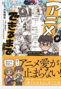
『アニメができるまで』 大塚隆史 堀田孝之／著 (飛鳥新社)