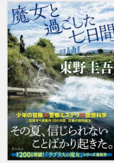
『魔女と過ごした七日間』 東野圭吾／著 (KADOKAWA)