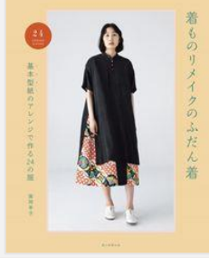
『着ものリメイクのふだん着 基本型紙のアレンジで作る24の服』 藤岡幸子／監修(朝日新聞出版)