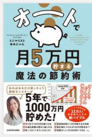
『オートで月5万円貯まる魔法の節約術』 ミニマリストゆみにゃん／著 (KADOKAWA)