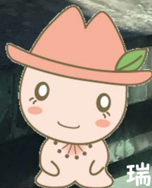
瑞穂区マスコットキャラクター「みずほっぺ」