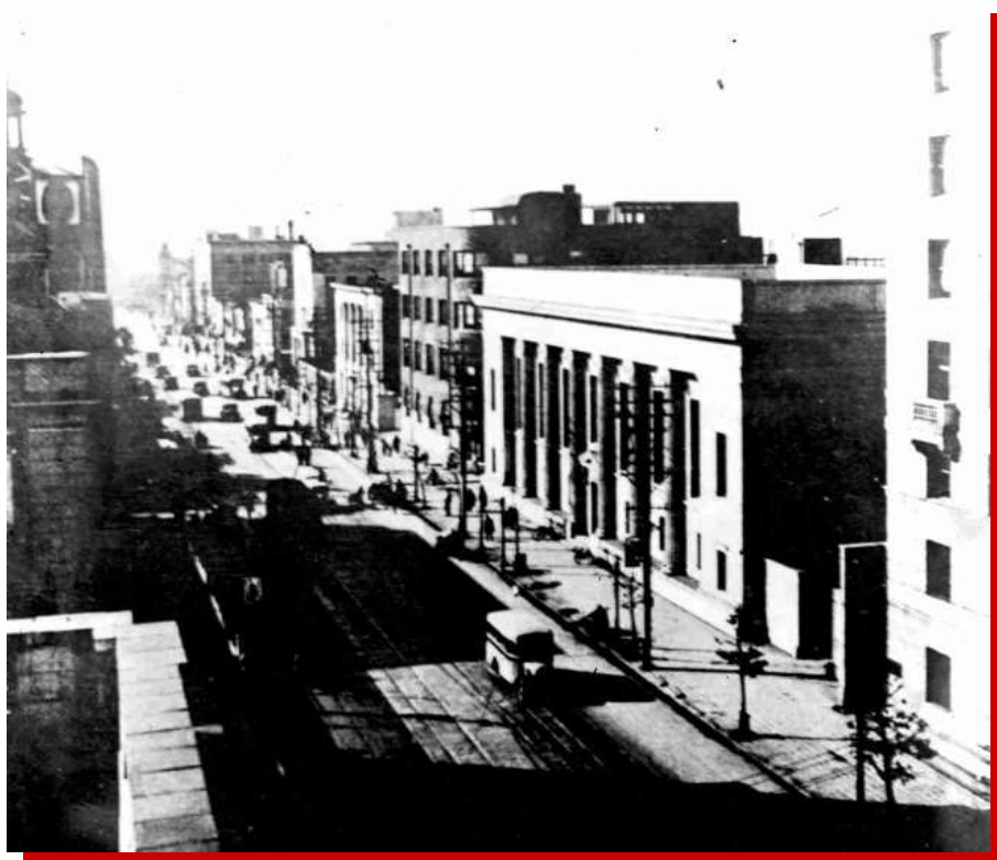
(1) 広小路通（撮影年不明）

2023年、1923（大正12）年に名古屋市図書館が開館して100年を迎えました。名古屋・愛知には、地元の息吹と歴史を伝えるたくさんの出版社・出版物があります。ぜひ、多くの本をご覧ください。