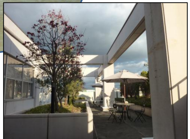
暖かい日はテラス席でお弁当を食べる人も。