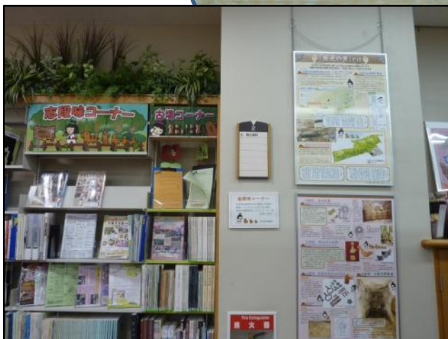
志段味古墳はじめ地域の情報満載コーナー