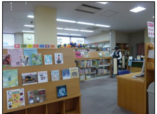
人気の児童コーナー。飾りつけもきれい