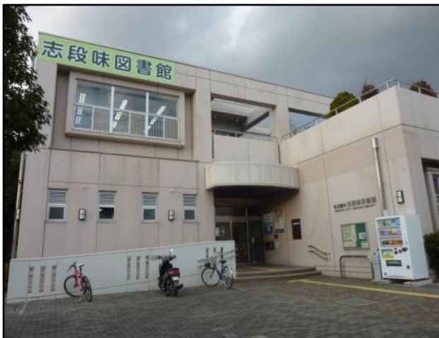
通りからよく目立つ明るい外観

★平成 16 年 7 月 15 日、名古屋市図書館 19 館目の図書館として、志段味支所管内に開館しました。実用書・読み物・児童書を中心に所蔵しています。身近な存在として地域の人に親しまれる図書館を目指しています。