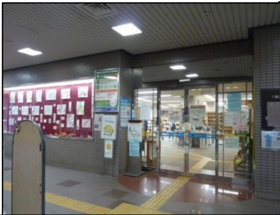
南小劇場と同じ建物。1,2階が図書館です。