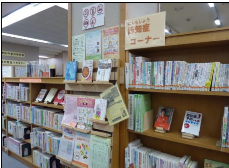
新設の「認知症コーナー」。本やチラシ、お役立ち情報がいっぱいです！