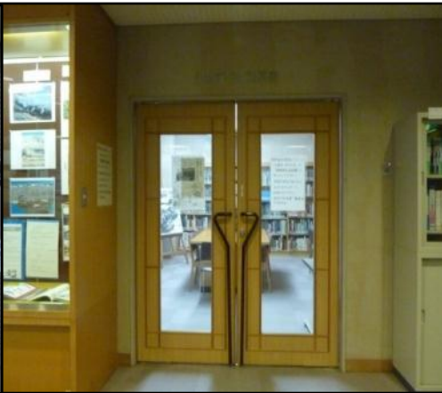
伊勢湾台風資料室。写真や解説展示も。