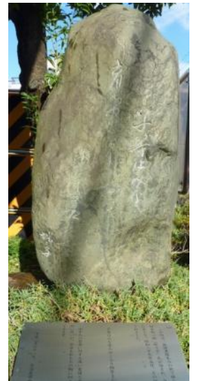
俳人としても知られる寄付者の句碑 (東入口横)