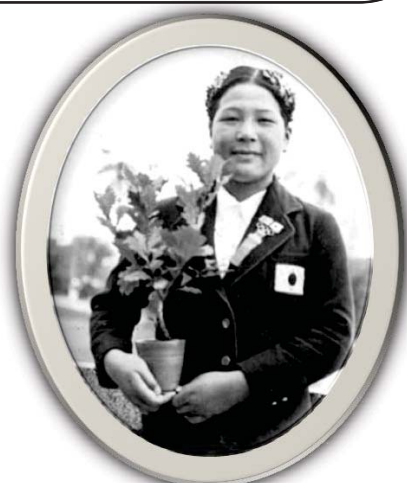
金メダル取得後 会場にて

前畑さんの故郷、和歌山県橋本市では実行委員会を立ち上げ、2020年東京オリンピック・パラリンピックを機に、前畑秀子さんが歩んだ「努力」の道をもう一度、「NHK朝の連続テレビ小説」として再現し、前畑さんの功績と精神を伝えていきたいと、朝ドラの誘致活動を行っています。