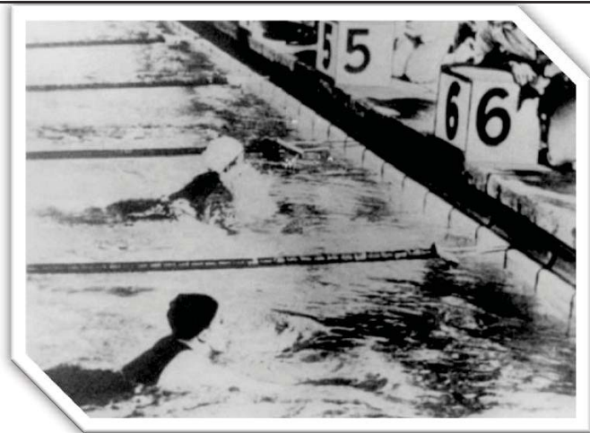
ベルリンオリンピック女子水泳 200m平泳ぎ決勝のフィニッシュ (奥が前畑さん)

前畑さんは引退後も、水泳教室開催、市営プール設置に尽力するなど、80歳で亡くなるまで水泳の普及や後進の育成に熱心に取り組みました。