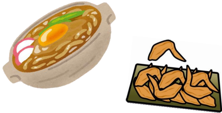
『名古屋味覚地図』 1965年版より