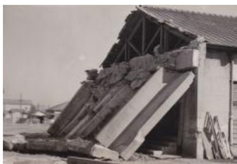
30cmもある防火壁が中央で倒壊し通路をとぎす。