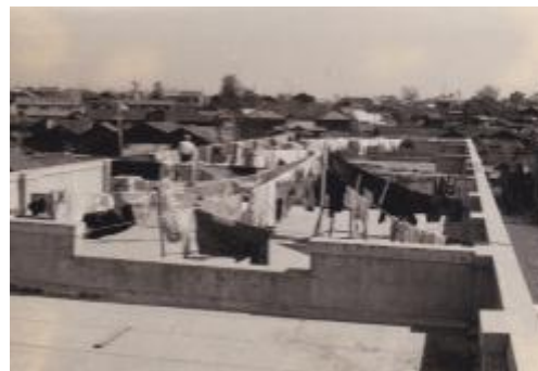
屋上に干された被災者の洗濯物。