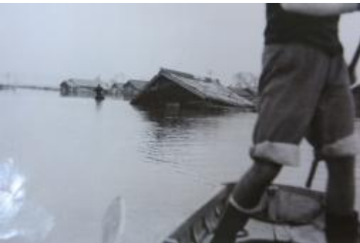
学校周辺の水没した民家。