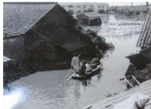
職員による生徒調査。