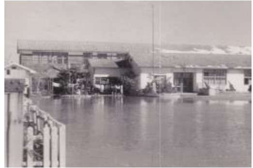
浸水初期の様子。校庭は15日間浸水。