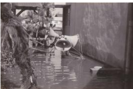
落下したスピーカー。