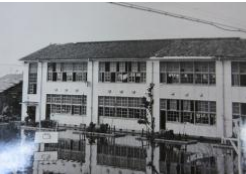
東臨港線から見た校舎。