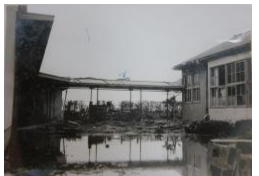
打ち寄せられた漂流物。