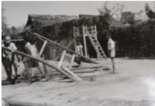
倒壊したバックネット。