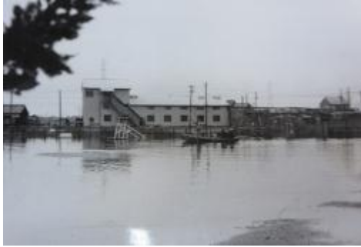
ボートを浮かべた校庭。