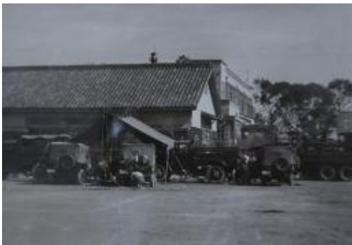
陸上自衛隊が駐屯し、救助活動を行った。