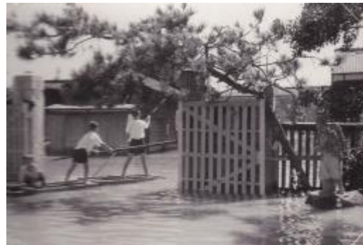
校門付近の浸水状況。