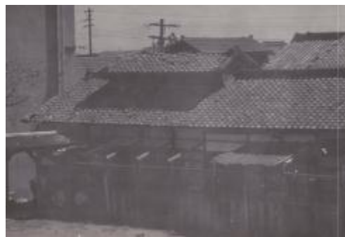
破損した給食調理所。