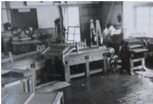
教室内でひっくり返った工作台。