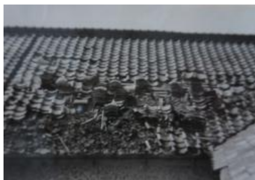
瓦が吹き飛んだ南校舎の屋根。