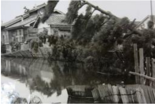
被害を受けた給食調理室。