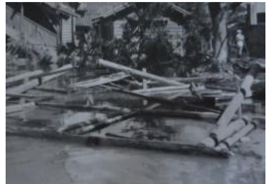
東通用門付近の破損状況。