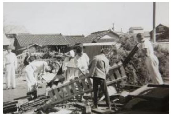
復旧作業（流出物の整理）。