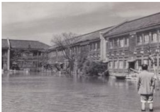
水中に没しつつある運動場。