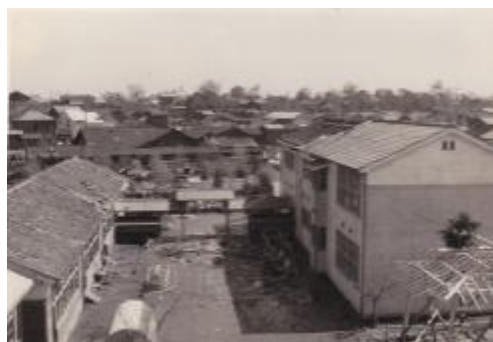
鉄筋校舎屋上より中校舎。教室の屋根が吹き飛ばされる。