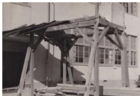
破損した渡り廊下。