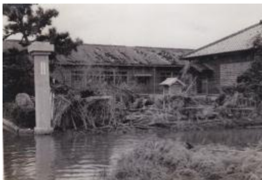
台風直後の正門付近。