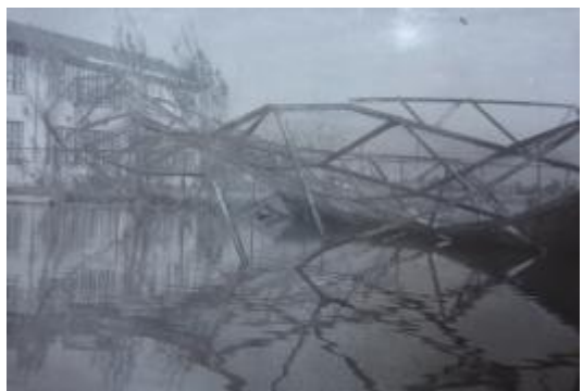
倒壊したバックネット。