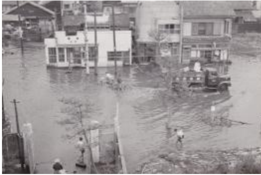
浸水後10日を経ても水の引かない校門前。