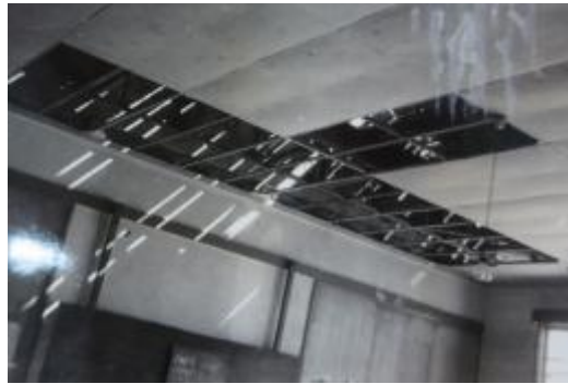
脱落した教室の天井。