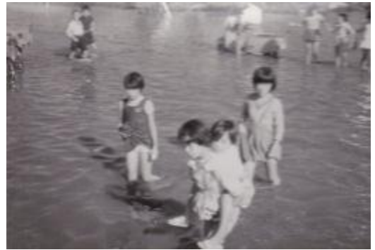
9月28日、八熊通りを通り学校へ。