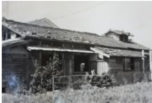
被害を受けた宿直室と作業員室。