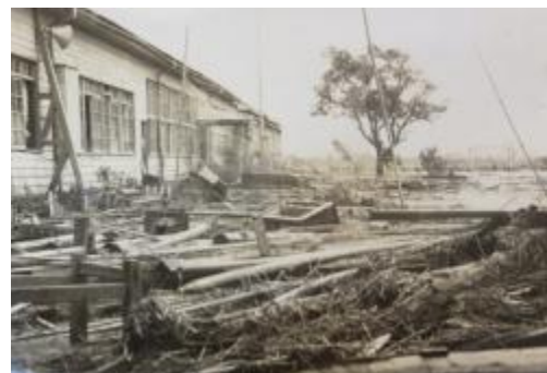
流木で埋まった校庭。