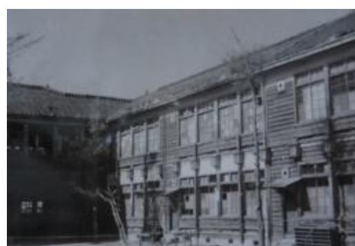
瓦や雨どいの破損した校舎。