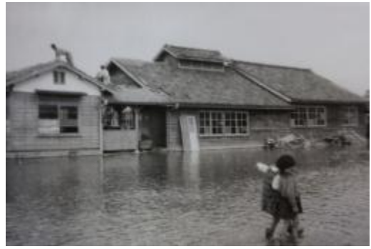
浸水した作業員室。