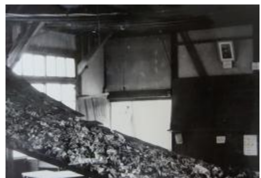
落下した校舎の天井。