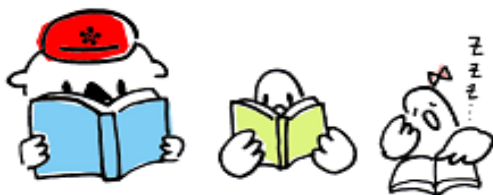
★ 読書 かもめの「とっしー」「おまつ」と本を読みます。利家(としいえ)とまつにちなんだ名前です。