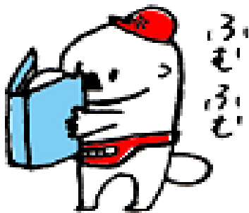
★ 立ち読み あらっこは本が好きなんです。