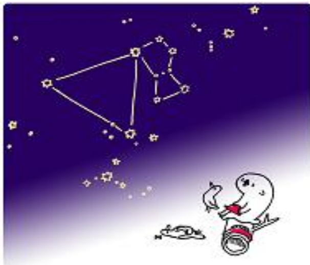
★ 冬の大きな三角形 あらっこは星を見上げるのも好きです。時を忘れていろんなことを考えてしまいます。