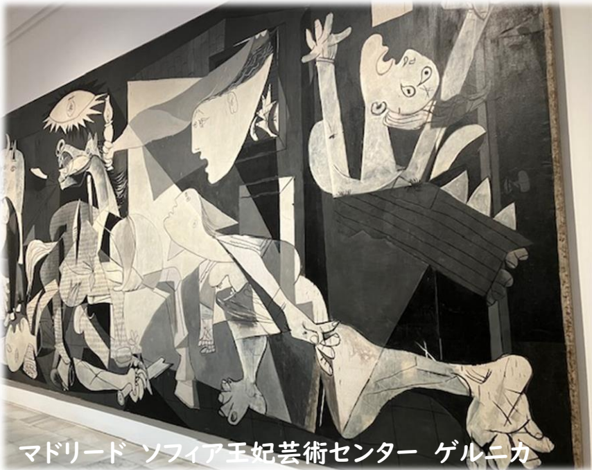
マドリード ソフィア王妃芸術センター ゲルニカ