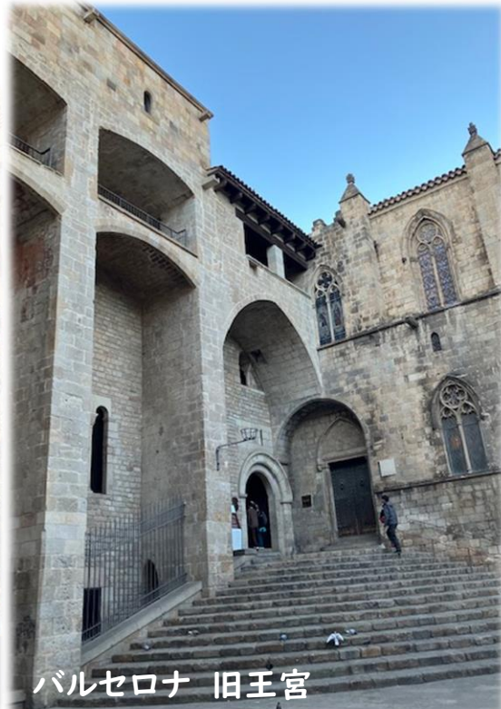
バルセロナ 旧王宮