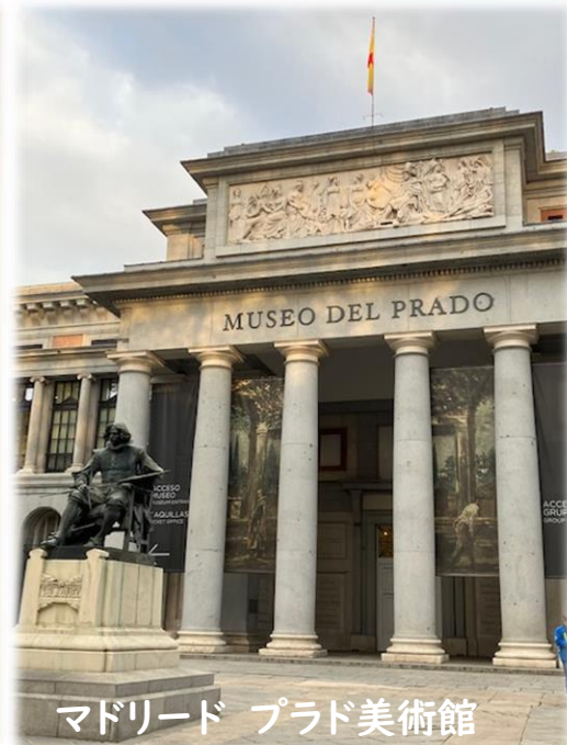
マドリード プラド美術館