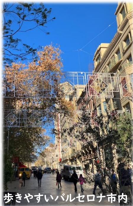
歩きやすいバルセロナ市内