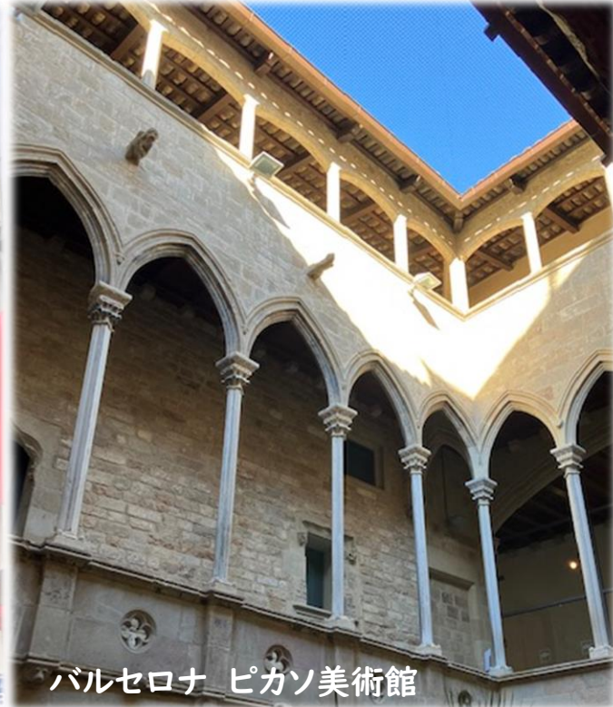
バルセロナ ピカソ美術館