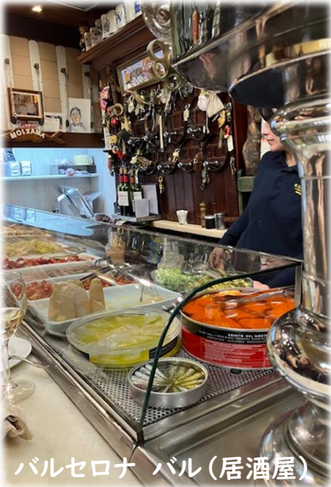
バルセロナ バル(居酒屋)

1852年、スペインのカタルーニャ地方に生まれたアントニ・ガウディは、バルセロナを中心に、見る者に強烈な印象を与える建築群を遺しました。市美術館での特別展にあわせ、ガウディが育ち、影響を受けたバルセロナやスペインを知る本をそろえました。ぜひご覧ください。