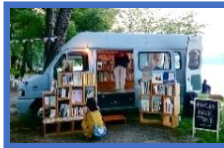
移動式本屋 BOOK TRUCK (神奈川県横浜市)

行く先に合わせ品揃えや形態が変わる移動本屋。小説を音楽にするユニット YOASOBI とコラボした「旅する本屋さん YOASOBI 号」プロジェクトで人気！