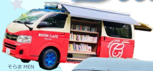
そらま MEN (鹿児島県指宿市)