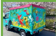
はちっこぶっく号ミニ (滋賀県近江八幡市)

軽自動車ならではの小回りの良さを活かし、名古屋市内各所での活用を企画。ヨシタ ケシンスケさんのデザインで、明るく元気に地域をブ〜んと回ります！