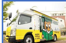
さつき号 (岐阜県各務原市)

はちっこぶっく号ミニは、「市内の園児全てに同じ絵本体験を」を目標に就学前施設を巡回しています。ミニにかくされた3つのひみつを見てください！