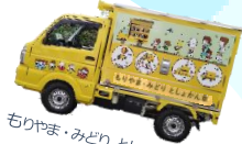
ちりやま・みどりとしよかん車 (名古屋市)