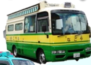
なごや号 (名古屋市)