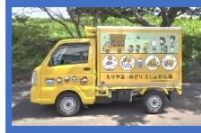
もりやま・みどり としよかん車 (愛知県名古屋市)