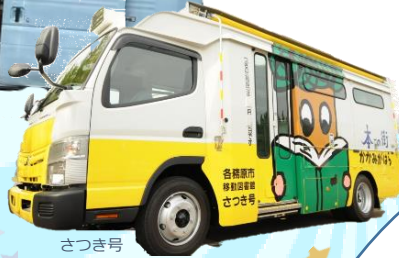
さつき号 (各務原市)