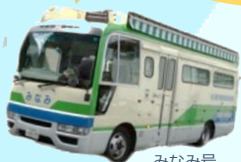
みなみ号 (名古屋市)