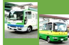
みなみ号/なごや号 (愛知県名古屋市)

3千冊積載できる車体には、絵本作家 高島純さんデザインのキャラクター「ブックキ」がペイントされています。子どもたちがブックキに手を振ってくれることも♪