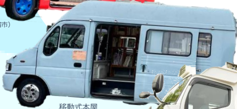
移動式本屋 BOOK TRUCK (横浜市)