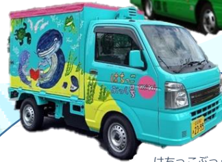
はちっこぶっく号 ミニ (近江八幡市)