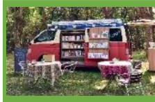
ブックカフェ号 そらま MEN (鹿児島県指宿市)

行く先に合わせ品揃えや形態が変わる移動本屋。小説を音楽にするユニット YOASOBI とコラボした「旅する本屋さん YOASOBI 号」プロジェクトで人気！