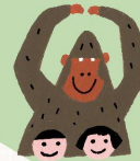
なごや子ども応援委員会

わたして みんなとちがう？ 友だちって 多くなきゃだめ？ 困ったときには どうすればいいの？ そんなとき考えるためのヒントになる本があります。