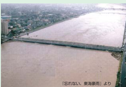
『忘れない、東海豪雨』より