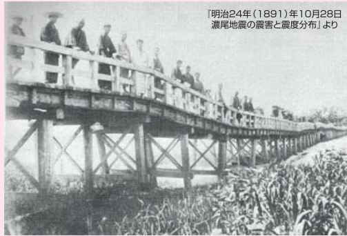
『明治24年(1891年)10月28日濃尾地震の震害と震度分布』より

濃尾地震は、1891(明治24)年10月28日午前6時38分に岐阜県本巣郡根尾村を震源として発生した国内最大級の inland 地震です。2府12県の広範囲で、死者7,880人、全壊建物164,611棟、半壊建物123,158棟という甚大な被害が出ました。愛知県では2,638人が亡くなりましたが、うち名古屋市中では187人(人口約16万5千人)、愛知県では152人(人口約12万3千人)、海東郡では289人(人口約8万4千人)となっています。区内は震度7の揺れに見舞われたと推定され、下之一色村では液状化現象も見られました。