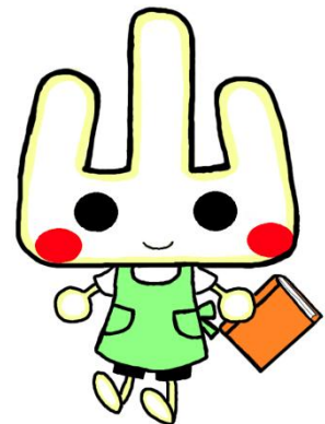
山田図書館「ヤマリー」

★ タイトルコードは、名古屋市図書館の本のコードです。問合・予約にご利用ください。紹介本以外にも文庫版などがある本もあります。