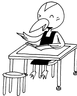
鶴舞中央図書館「つるちゃん」