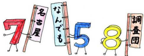
鶴舞中央図書館「758(なごや)くん」