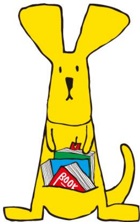
名古屋市子ども読書活動推進計画 「ヨンデルー」