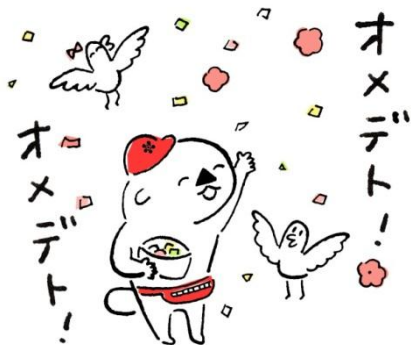
中川図書館マスコットキャラクター「あらっこ」