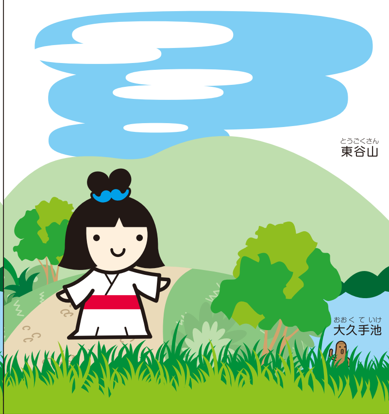
とうごくさん 東谷山