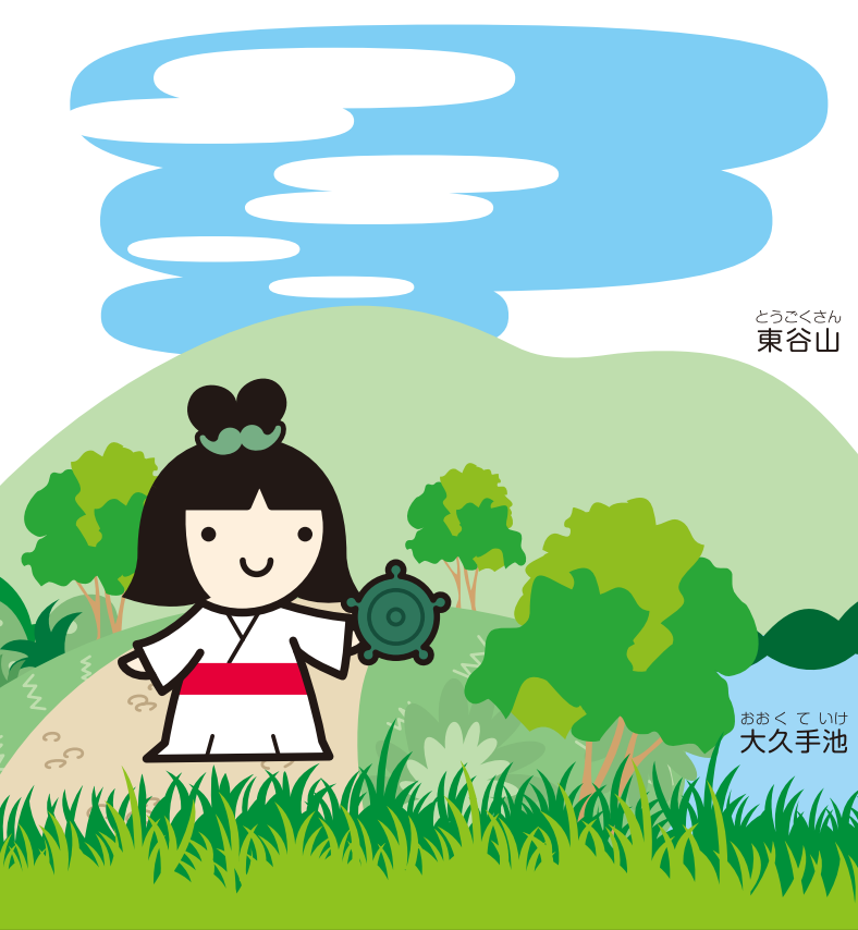
とうごくさん 東谷山