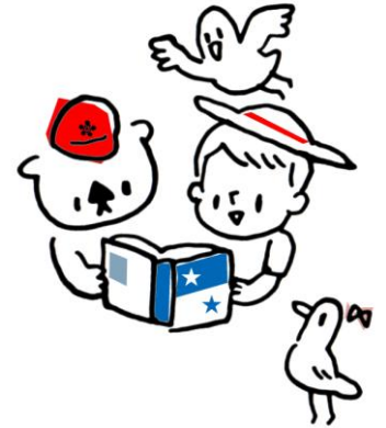
中川図書館マスコットキャラクター「あらっこ」とそのなかまち

「名古屋市立図書館共通貸出券」はゼロ歳からお作りします。健康保険証等の証明書をお持ちください。