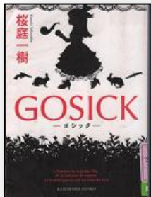
GOSICK—ゴシック— 桜庭一樹／著 (株)KADOKAWA 角川書店

物語の舞台はヨーロッパの小国ソヴェール。ある日豪華客船に招待されたヴィクトリカたちは、殺人事件に遭遇し…。