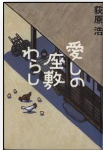
愛しの座敷わらし 荻原浩／著 朝日新聞出版

どこにでもあるような問題を抱えた家族の面々が、座敷わらしの存在を通してきずなを取りもどしていく物語。