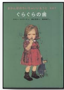
きかんぼで、わがままで、でもなぜか憎めない、愛すべき妹についての短編集。