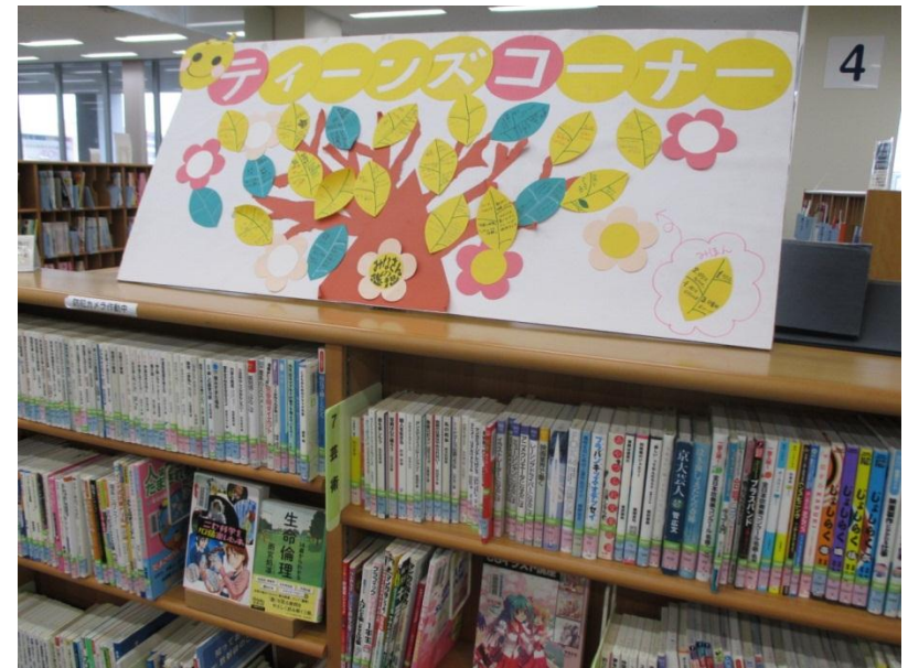
写真・東図書館ティーンズコーナー