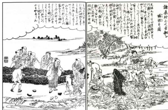
「諸桑村にて古船を掘出だす図」

実はこの可能性を感じさせる発見が天保9年（1838）閏4月3日に 海東郡の諸桑村 でありました。この発見はいち早く瓦版として報じられ、その後『尾張名所図会 前編卷之七』や「想山著聞奇集」（『日本庶民生活史料集成 第16巻』（三一書房 1970年）所収）でも紹介されるほどのビッグニュースでした。（→『佐織町史 通史編』（佐織町 1989年）に詳しいです。）それは、諸桑村の満成寺裏から長さ24メートル余、幅約2.2メートルというとても大きな 古船 （丸木舟）が発掘されたという事件でした。『尾張名所図会』によると、船の中からは“古瓦古銭その余異形の珍器”が、付近からは“木仏像”も発掘されました。そして、なぜこのような古船が地中に埋まっていたのか、その理由について大昔はこの辺りは海でそこに船が沈んだものか、あるいは、大昔はこの辺りまで川で川船が沈んでいつのまにか埋まったものではないかと述べられています。