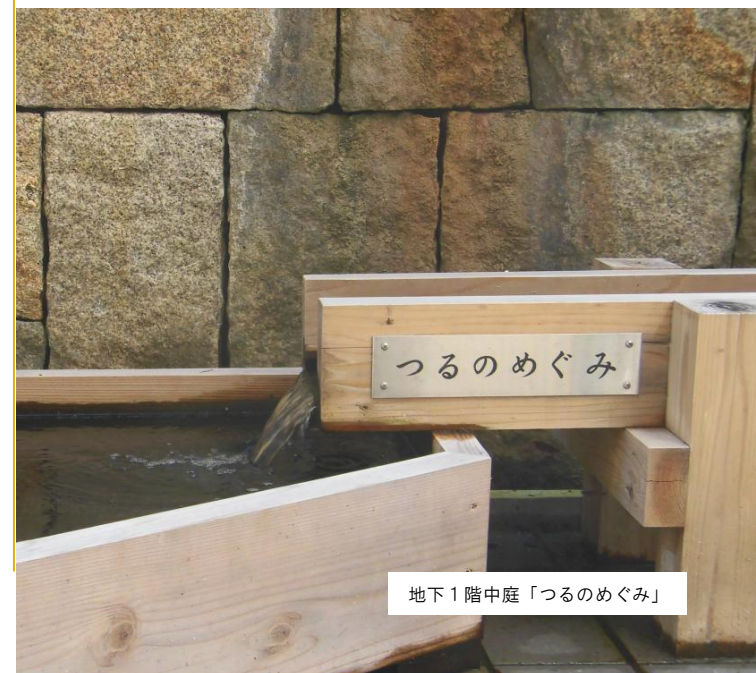
地下1階中庭「つるのめぐみ」