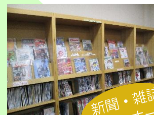
新聞・雑誌コーナー