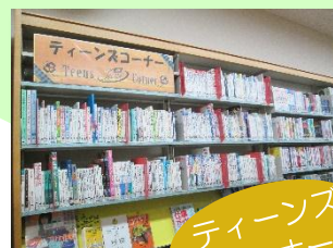
ティーンズコーナー