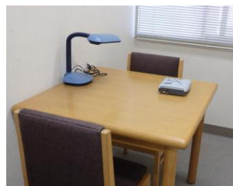
対面読書室 机の上にある機械は？