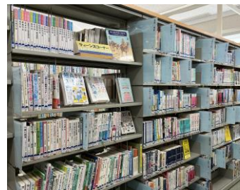
ティーンズコーナー