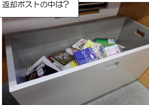
返却ポストの中は？