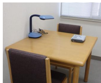
対面読書室 机の上にある機械は？