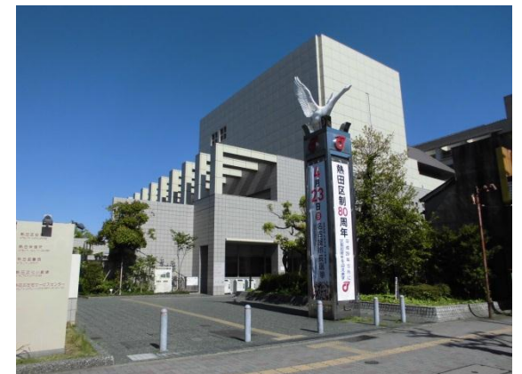
地下鉄・JR など交通アクセスに恵まれた図書館です。