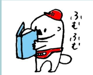
名古屋市中川図書館 マスコットキャラクター あらっこ