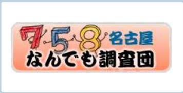
名古屋に関する調査ならお任せを！ 名古屋なんでも調査団

大量の情報が行き交う現代は、探し求める情報に的確にたどり着くことが大変な時代でもあります。探している情報が見つからない、もしくは見つけ方が分からない、というときに気軽に相談していただける図書館をめざします。