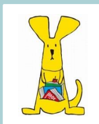
「名古屋子ども読書活動推進計画」のマスコットキャラクター ヨンデルー

学校での調べ学習に図書館が支援を行ったり、司書が読み聞かせやブックトークのために学校を訪問したりしています。子どもたちにとって読書がもっと身近になるよう、これからも学校との連携を進めていきます。